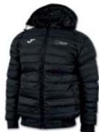
DXT Anorak 50,00€